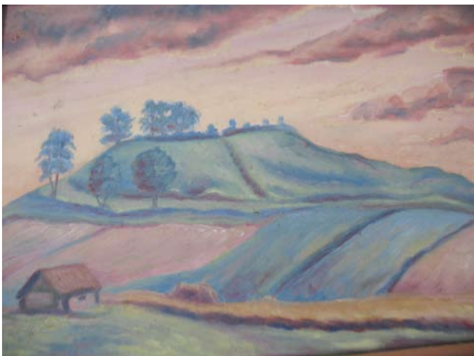
Tuoj po 1960 metų Stasys Karanauskas nutapė seriją paveikslų su Aukštaitijos piliakalniais.