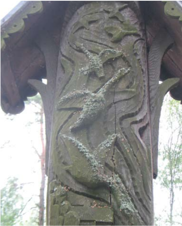
Paminklo Cecilijai Pliupelienei Butėnų kapinėse gulbės kyla ir leidžiasi...