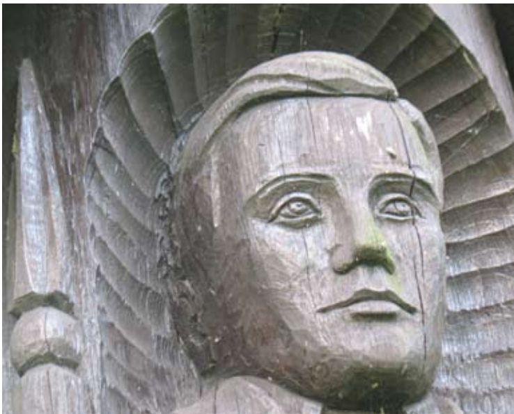
Šviesaus veido 1863 m. suskilėlių vadas kun. Antanas Mackevičius. Paminklo Svėdasuose fragmentas.