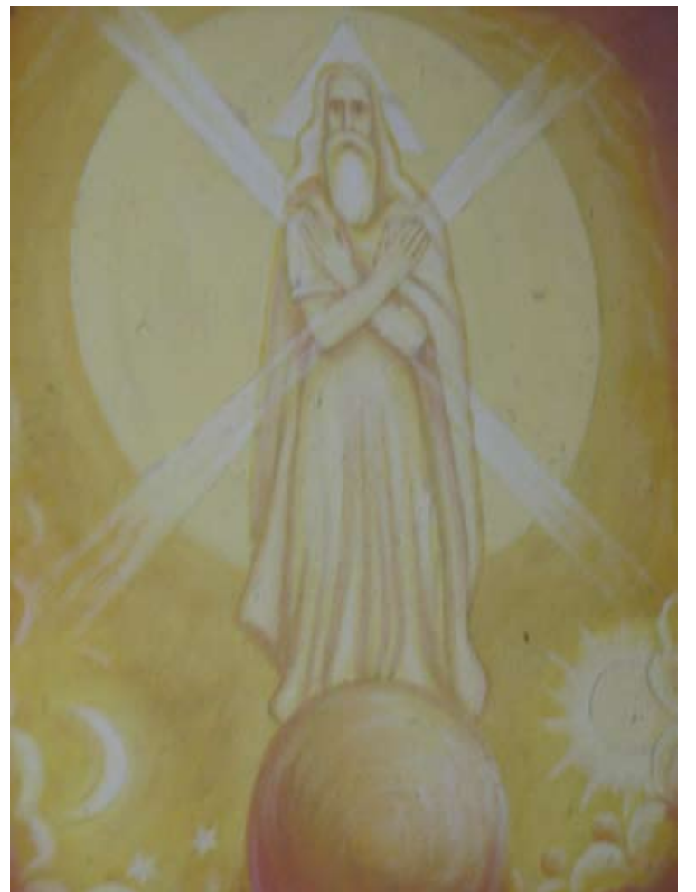
Didžiojo meistro paveiksle - visagalis Dievas.

Knietėjo ir lemtį pergalėti. Šį atkaklų žmogų vos dvylikos metų ištiko didi nelaimė - po sunkios ligos neteko klausos, tad visą likusį ilgą laiką teko gyventi įsivaizduojamų garsų pasaulyje. Garsų nebūtis suteikė galimybę daugiau matyti ir daugiau jausti liečiant, uodžiant. Visuomet gebėjo ir geba susikalbėti - jam parašo ant lapelio ar tiesiog pavadžio pirštu ant delno, daug ką sugauna iš judančių lūpų. Kadai ne galėjo naudotis telefonu, tačiau, atsiradus mobiliui, jį puikiausiai išnaudoja - bendrauja rašydamas laiškus. Niekuo met nepraranda vilties - smalsumo ir tikėjimo genamas, buvo nukeliavęs pas Said Babą. Kaip aplinkiniai užsimena - tikėjęsis, kad tas išmintimi ir tikriausiai stebuklais garsėjantis žmogus sugrąžins klausą. Tačiau pasiliko kaip buvę - matyt, tokia Dievo valia.