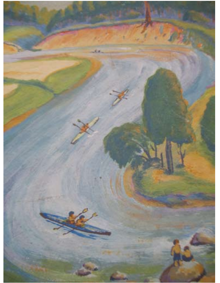
Šventosios vingis ties Pagriauže.

Kaimo papėdėje sruveno Šventoji, švelniai sukdamą pro melsvus šilus vingiais, plaudama statų smėlio krantą ties Pagriauže, šniokš-