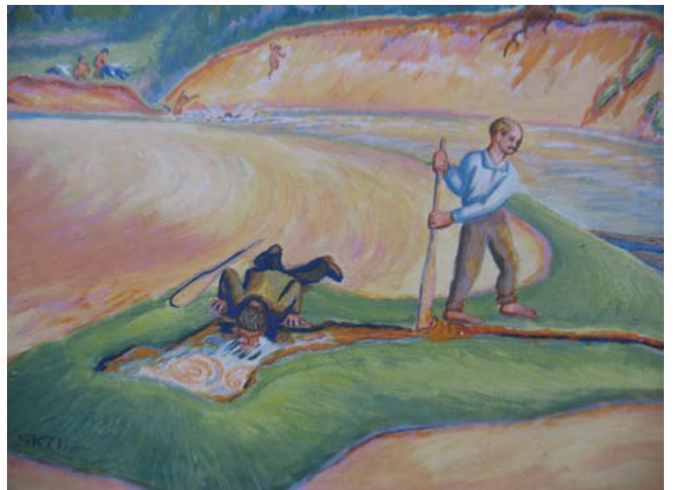
Iš Šaltinių kaimo šaltinio visuomet atsigerdavo finklus traukiantys žvejai.